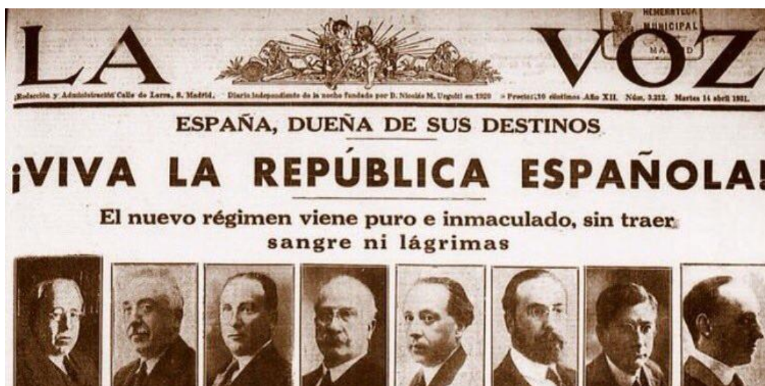
Miembros del Gobierno Provisional en 1931