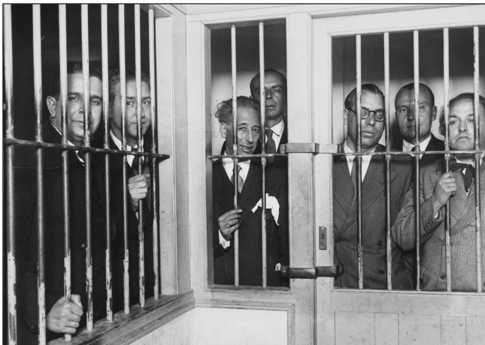
Los miembros del Gobierno catalán encarcelados, con Lluís Companys en el centro

Al mismo tiempo, pero por razones distintas, se desarrollaba otro episodio revolucionario en Cataluña. Lluís Companys , que había sucedido a Maciá como presidente de la Generalitat, proclamó el “Estado Catalán dentro de la República Federal Española” . Pero las masas obreras permanecieron pasivas y bastaron unos disparos de cañón para provocar la rendición de los sublevados. Esto significó la suspensión total del Estatuto y el encarcelamiento del gobierno catalán.