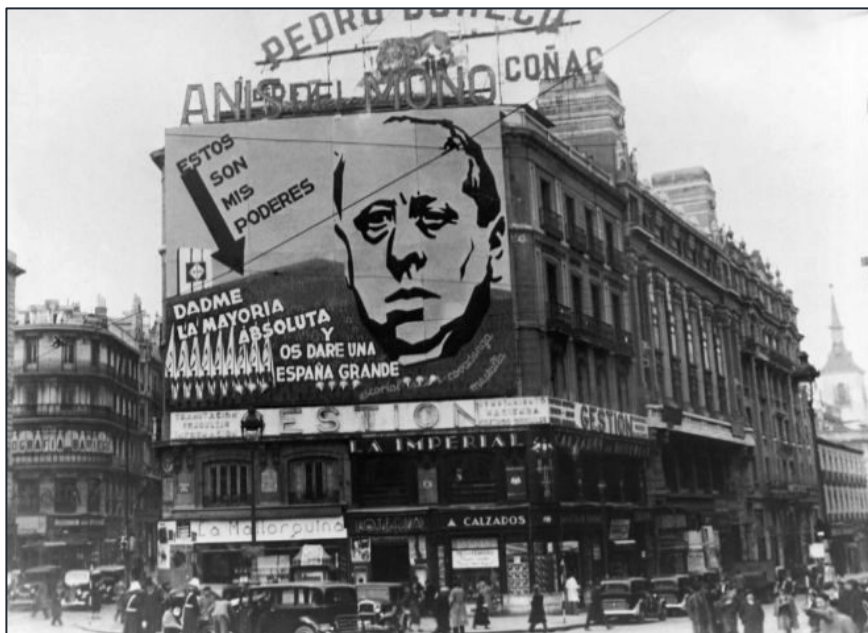
Cartel publicitario del partido político de José María Gil Robles