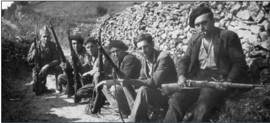
Milicianos de la Revolución de Octubre de 1934

Los refuerzos que llegaban desde Castilla eran incapaces de detener a aquel ejército revolucionario; por eso Gil Robles ordenó el envío de unidades del ejército de Marruecos, regulares y legionarios, lo que dio a la contienda un sesgo aún más feroz. La lucha duró dos semanas: los muertos fueron centenares, miles los heridos y miles también los detenidos, entre ellos el propio Largo Caballero.