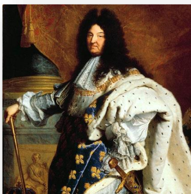
Luis XIV de Francia, El Rey Sol (modelo de rey absoluto por antonomasia)